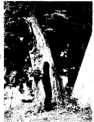
Saatzig „Hohle Linde“ an der Kirchenruine

Von Jacobshagen fahren wir in das Dorf Saatzig. Die einst existierende Burg „Sazig“ ist der Namensgeber unseres Kreises. Hier kann man das vom Heimatkreis restaurierte Kriegerdenkmal von 1914-1918 besichtigen. Die Restbestände der Kirche sowie eine uralte Linde mit einem ausgehöhlten Stamm. In diesem Stamm versteckten sich schon unsere Urgroßeltern als Kinder bei ihren Spielen. Diese Linde ist als Naturdenkmal ausgezeichnet und grünt Jahr für Jahr neu aus!