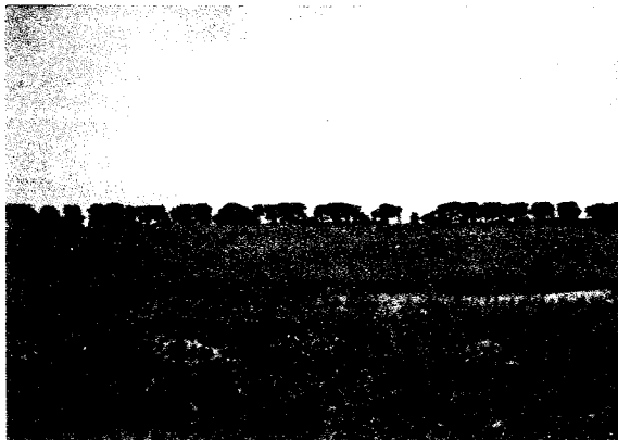
Feldmark Kashagen zum Kempendorferweg