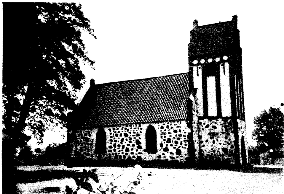
Kirche in Mulkentin