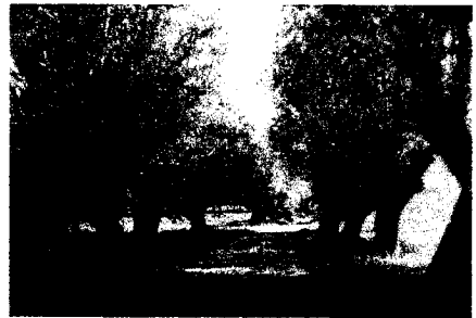
Baumallee an der Straße vom Dorf Braunsforth nach Kolonie Berthelm

Auf dem Friedhof an der Kremminer Straße steht das Kriegerdenkmal von 1914-1918 und ein Gedenkstein zur Erinnerung an die deutschen Bewohner, ebenfalls eine Spende ehemaliger Einwohner. Für Wanderfreunde gibt es das Ihnatal bis zu der Quelle des Flusses Ihna in der Gemarkung Klein Grünow zu erkunden.