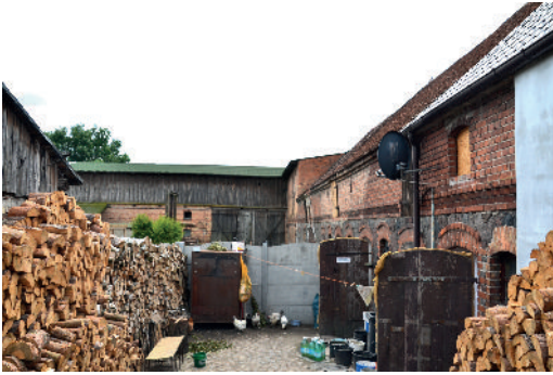
Blick in den Innenhof - ehemals H.Welk

Nun drängte die Zeit zur Weiterfahrt und eine herzliche Verabschiedung mit dem Versprechen im Jahr 2015 einen Besuch zu machen. Die Fahrt ging nach Gräbnitzfelde, wo einige Mitreisendem einen kurzen Aufenthalt wünschten, um sich den Rest des Dorfes anzusehen. Danach setzten wir unsere Fahrt über Jacobshagen, Kempendorf, Büche, Marienfließ, Barskewitz bis Brüsewitz fort.