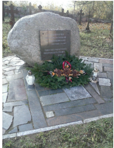
Gedenkstein in Langenhagen