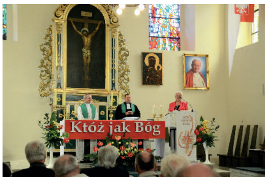
Kirche in Jacobshagen