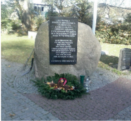
Gedenkstein in Bucholz