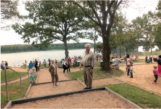
Blick in die Anlage der Badestelle in Kremmin