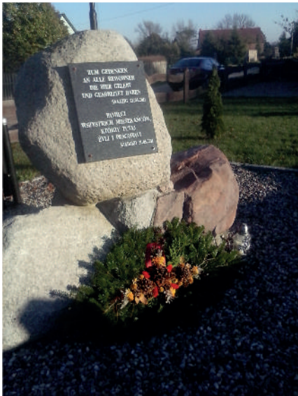
Gedenkstein in Saatzig