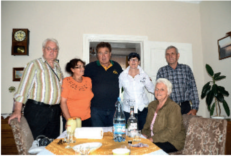
Familie Miziolek und Besuch