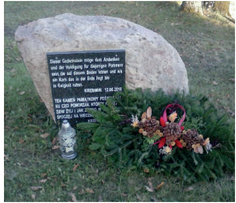
Gedenkstein in Kremmin