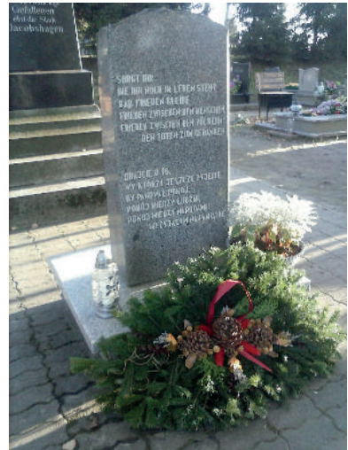
Gedenkstein in Jacobshagen