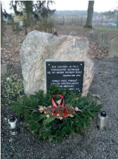
Gedenkstein in Grassee