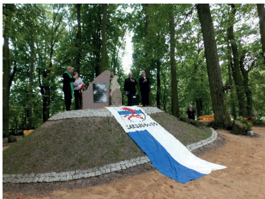
Gedenkstein im Park