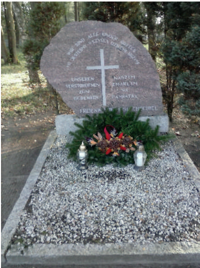
Gedenkstein in Freienwalde