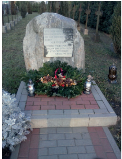
Gedenkstein in Alt Storkow